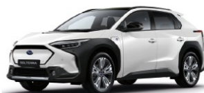
Platinum White Pearl