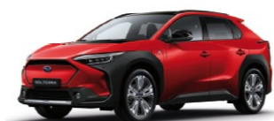
Emotional Red Metallic*