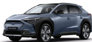
Harbor Mist Grey Pearl