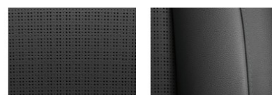
Piele ecologica de calitate superioara

* Culoarea exterior: Emotional Red Metallic respectiv Caroseria in doua culori : Harbor Mist Grey Pearl / Black Mica nu sunt disponibile pentru echiparea Confort