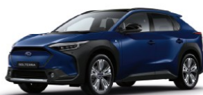
Dark Blue Mica