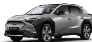
Precious Metal Metallic